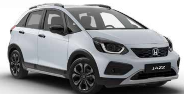
Premium Sunlight White Pearl