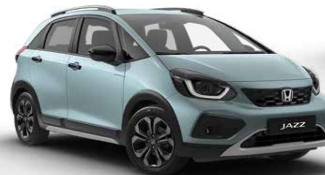
Fjord Mist Pearl