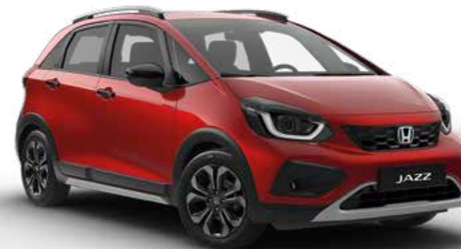
Premium Crystal Red Metallic

Vi har skapat ett brett utbud av kulörer som passar snygga nya Jazz Crosstar perfekt, kompletterade med våra högkvalitativa klädselar.